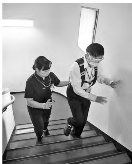
高齢者疑似体験の様子