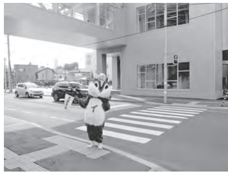
空中歩廊下の道路には横断歩道が完成