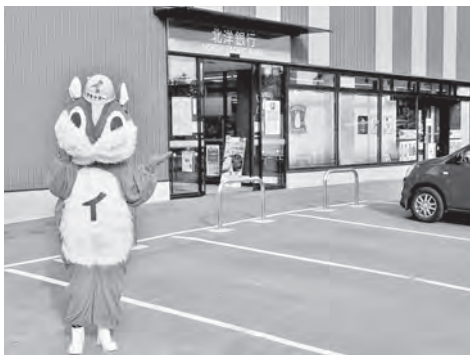
北洋銀行隣にはローソンがオープン