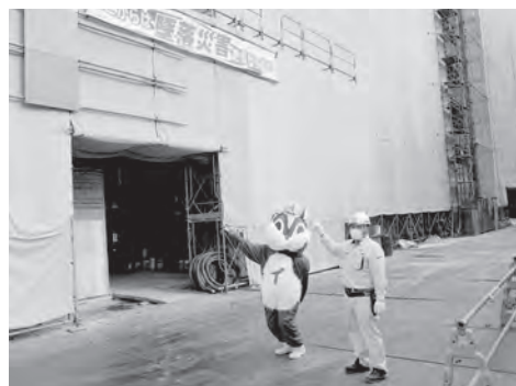
工事は安全第一！建物の形が見えてきました