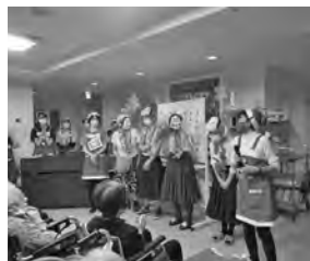
昨年のクリスマス会

く、ご入居者からの評判も上々。年に一度はマグロの解体ショーを披露したり、ご入居者のそばで鮭のチャンチャン焼きを提供するなどおいしさを演出しています。もちろん、ご入居者の中にはご家族と一緒に外食を楽しまれる方もいらっしゃいます。