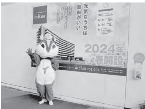
苗穂駅改札口から「イリス苗穂」まで徒歩約5分