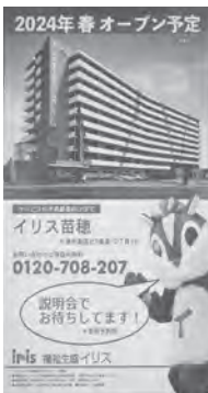
アリオ札幌 サイネージ