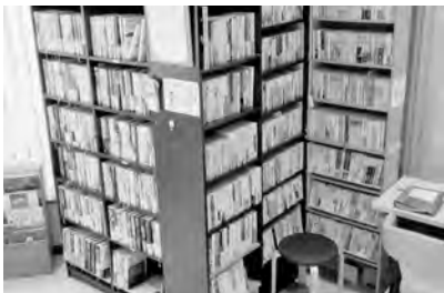
1階の図書コーナー

イリス南郷通には、充実した図書コーナーがある。ご入居者の運営、寄贈で成り立つ図書コーナーの中で、つい「高齢者の心理」に関する本が目が向いてしまう。病気に関する本や高齢の著者の自己啓発本など、さまざまなジャンルが並ぶ本棚で、ご入居の皆さまがどのような本を読まれているのか、これからの生活をどのように過ごされていきたいのか、どのようなことに不安を持たれているのか、「高齢者の心理」を少しでも理解したいと想い図書コーナーに足を運ぶ。曲がりなりにも福祉関連の名著には目を通してきた。本から得られることも多いが、本や日々の仕事の経験からだけでは、