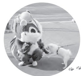
散歩中のワンちゃんともすぐに仲良し