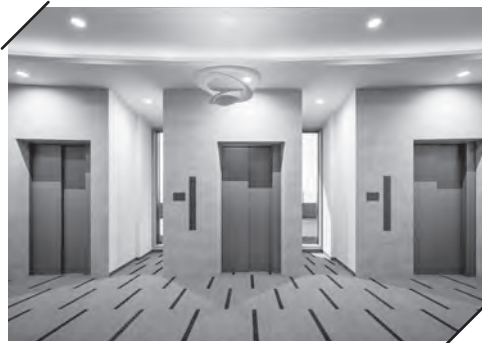
1階エレベーターホール