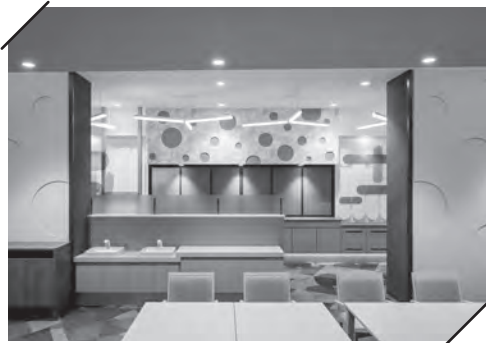
レストランカウンター