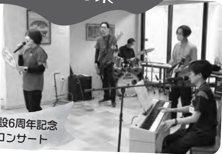
開設6周年記念コンサート

開設6周年を記念して職員のバンド演奏による開設記念コンサートを開催しました。たくさんのご入居の皆さまにお集まりいただきました。